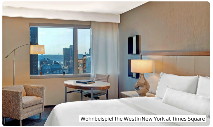
Wohnbeispiel The Westin New York at Times Square