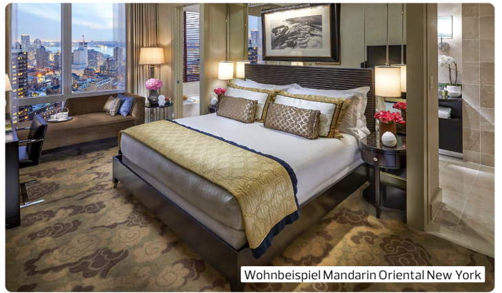
Wohnbeispiel Mandarin Oriental New York